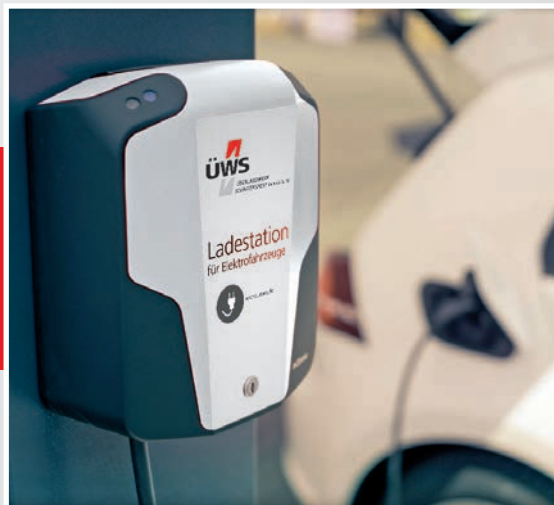
Wandladestation eMH1 mit 11kW

Eine eigene Wandladestation hat viele Vorteile. Profitieren Sie vom erfahrenen Komplett-Service der ÜWS und sichern Sie sich 250,00 Euro Förderung!